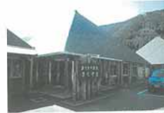
おくるとる公園。併設されているおくるとる温泉には湯師を眺めながら入れる露天風呂あり