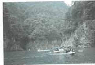
瀬峡、断崖絶壁に囲まれた広大なトロップ。上流で流れる河原があまりないので、沈没は避けたい