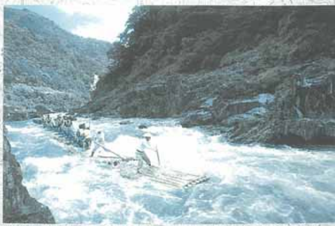
北山川の観光いかだ下り。もちろんいかだ優先。むやみに近寄ると船員さんからのめづらげ