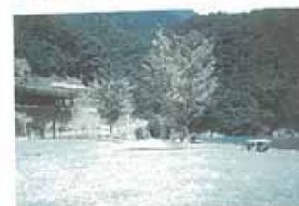
森林浴エリアのキャンプサイト。川が見下ろせる。すぐ前に天然の湧き水あり