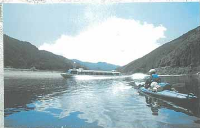
ウォータージェット船。浅瀬でも航行できるようにスクルーではなく、水を噴射する