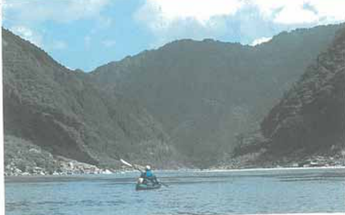
見よ! この川の深さ、流れに身を任せて熊野の大自然をたっぷり堪能してほしい!

コース | 北山村オトノリ(北山川)~新宮市 熊野大橋上流/約 53km グレード | Ⅱ~Ⅲ(Ⅲは北山川エリア) 主流ポート | ① オープンデッキカヌー ② フォールディングボート ③ カヤック ④ ダッキー ⑤ ラフト