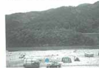
小川口の広い河原。車の乗り入れが容易(2車もOK)。ハイシーズンはキャンパーで賑わう