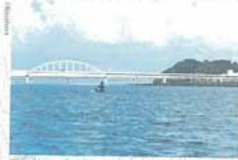
河口付近の熊野大橋手前。「やっと着いた」「もう着いてしまった」。あなたは、どっち？