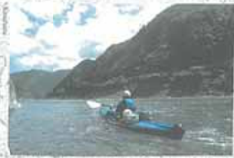
熊野川にはフォールディングカヤックがよく似合う。本物の「川流」ができる川ということだ