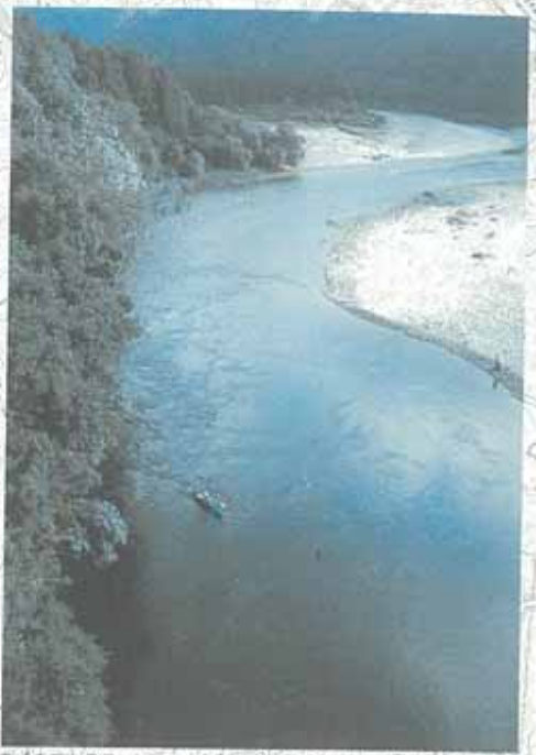
あくまでもスローに。できれば、2泊、3泊と時間をかけて下りたい